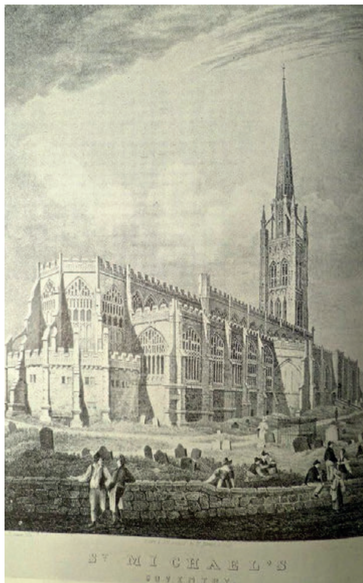
L'église Saint-Michel a été en grande partie construite entre la fin du xiv e siècle et le début du xve siècle. C'était la plus grande église paroissiale d'Angleterre. Elle devint cathédrale en 1918.

Autant dire qu'en 1952 les britanniques en parlent encore de ces mois terribles. Et le jingle devient une réalité. Réalité qui deviendra encore plus tangible des années plus tard lors d'une visite à Coventry. Quel rapport avec le thème de ce Renouveau, vous demandez-vous ? Quel rapport entre Coventry et Notre Dame de Paris ? Saint-Michael Cathedral. Evidemment située à Coventry et victime du Blitz.