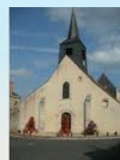
Notre-Dame de Varennes