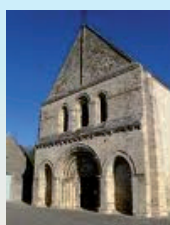
Notre-Dame de Bellegarde