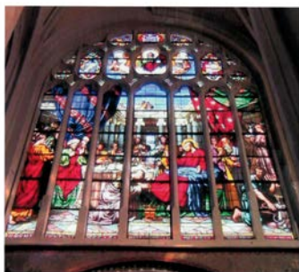
Les vitraux de Sainte-Madeleine