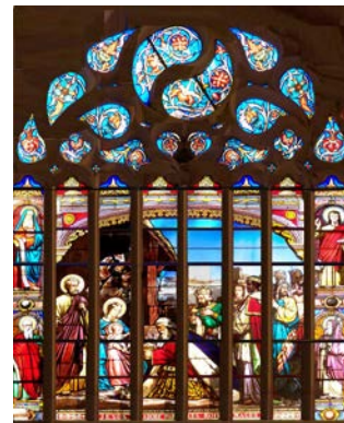
L'adoration des Rois Mages