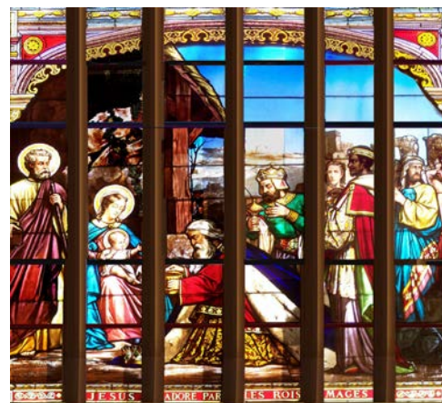
Jésus adoré par les Rois Mages

La tonalité de l'Évangile par les vitraux de la Madeleine est celle de la miséricorde de Dieu : « l'enfant prodigue », « la femme adultère », « la samaritaine » et « le repas chez Simon ou la pécheresse pardonnée ». Accessibles au regard de celui qui prend place sur les premiers bancs de l'église, 8 vitraux en hauteur dans le chœur de l'église, à droite côté sud, 3 vitraux représentent des scènes de l'Ancien Testament. En face d'eux, en correspondance sur la face nord, on trouve 3 vitraux qui représentent des scènes du Nouveau Testament, « Adam et Eve chassés du paradis », « La Pentecôte », « le sermon sur la montagne », « Moïse reçoit les tables de la loi », « le sacrifice d'Abraham », « le Christ en croix », « la résurrection de Lazare » et celui qui interpelle en ce temps de l'Avent : « l'Adoration des Mages ».