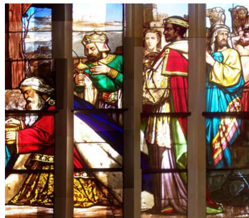
Les Rois Mages (détails du vitrail)