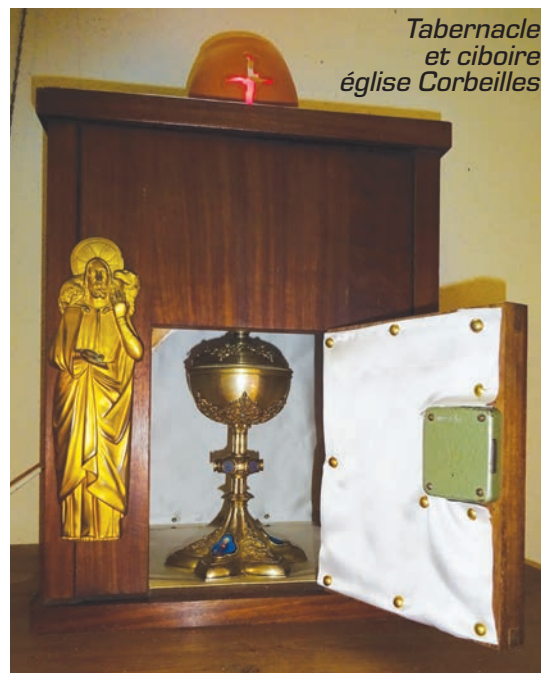
Tabernacle et ciboire église Corbeilles