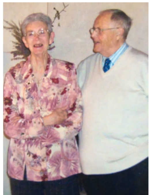
Les parents de Catherine