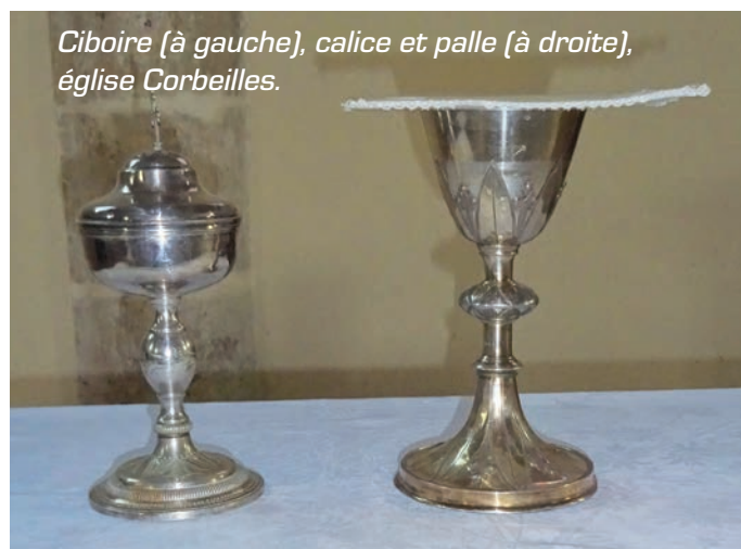
Ciboire (à gauche), calice et palle (à droite), église Corbeilles.

Pour vous convaincre du plaisir de cet exercice de société, spirituel et intellectuel, allons-y pour un apprentissage en règle de mots curieux et rares que nous ferons vivre ( étymologiquement... ), de mots qui parlent de la chrétienté, de son histoire.