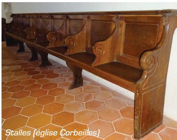
Stalles (église Corbeilles)