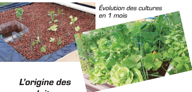
Évolution des cultures en 1 mois

C'est aussi une surveillance au quotidien cela demande peu de temps mais une grande attention. C'est lors du nourrissage que l'on constate la bonne santé du poisson et du système.