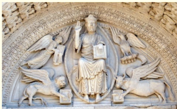
Tétramorphe : Saint Trophime d'Arles