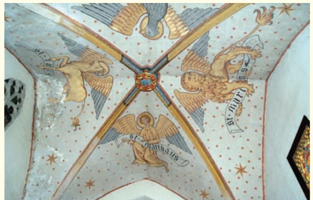
Tétramorphe : Saint Pierre le Jeune à Strasbourg