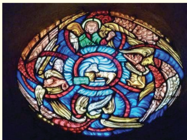
Tétramorphe : Le Vieux Cannel des Maures