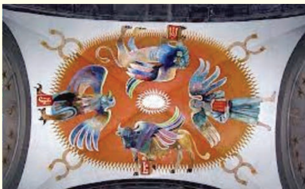
Tétramorphe : Notre dame de La Salette