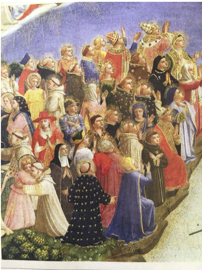
Le jugement dernier de FRA ANGELICO musée à Florence Détail des Saints au Paradis

Dans notre groupement, le prêtre célèbre une messe aux intentions de nos familles.