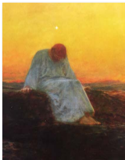
Couverture Magnificat n° 279 Février 2016

L'humilité n'est pas, comme le suggère l'étymologie, l'attitude qui consiste à se mettre « plus bas que terre », le regard baissé, telle une posture évoquant presque une mésestime de soi !