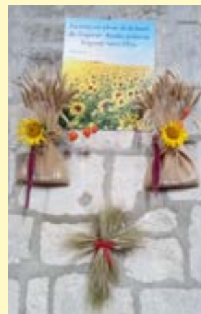
La terre est pleine de la bonté du Seigneur. Rendez grâce au Seigneur, Notre Dieu. Psaume 11

En complément des traditionnelles offrandes des produits de la terre, des tableaux exposés font références au Seigneur notre Dieu créateur de cette terre ! L'un dit : Tu visites la terre et tu lui donnes l'abondance, tu la combles de tes richesses !