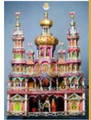
Crèche à Cracovie