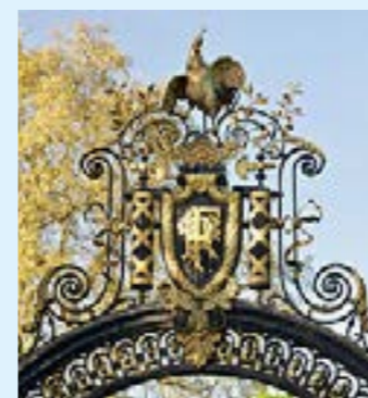
Coq gaulois de la Grille du Coq des jardins du Palais de l'Élysée de Paris.

Sans jamais avoir été désigné comme emblème officiel, le coq en est pourtant aujourd'hui un des symboles représentant la France les plus populaires... On le retrouve dans notre culture, mais également au niveau du sport, et de l'histoire. Une telle place peut nous faire nous demander pourquoi le coq est l'emblème de la France.