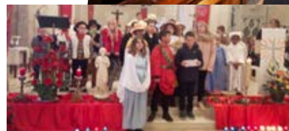
Veillée de Noël à Artenay ▲