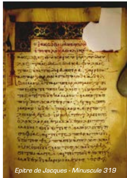
Epître de Jacques - Minuscule 319

Dans le premier exemple, il s'agit du mépris ou de la discrimination des pauvres (2.1-5) au sein de l'assemblée. Jacques nous invite à ne pas faire preuve de favoritisme comme il était courant dans la société gréco-romaine. Si un homme aisé portant une bague d'or et des vêtements magnifiques rejoint l'assemblée en même temps qu'une personne pauvre