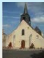
Notre-Dame de Lorris

VARENNES-CHANGY 1, place Duchesse de Dalmatie 45290 Varennes Changy Tél. 02 38 94 53 24 Permanences : Les 2 e et 4 e samedi du mois de 10 h. à 11 h30.