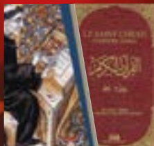
La Bible et le Coran