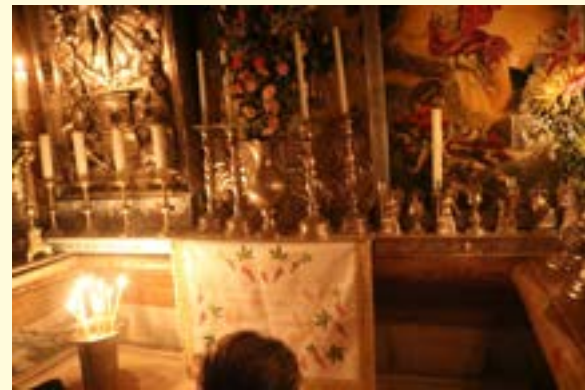
Le Saint Sépulcre

Arrivée à CÉSARÉE MARITIME : ville construite par Hérode le Grand Pierre « fondement » de l'Eglise ; puis la présence de Paul et son départ pour Rome : l'expansion de l'Eglise.