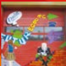
L'insertion des jeunes

Dieu vient à notre rencontre pour nous accompagner sur nos chemins de vie.