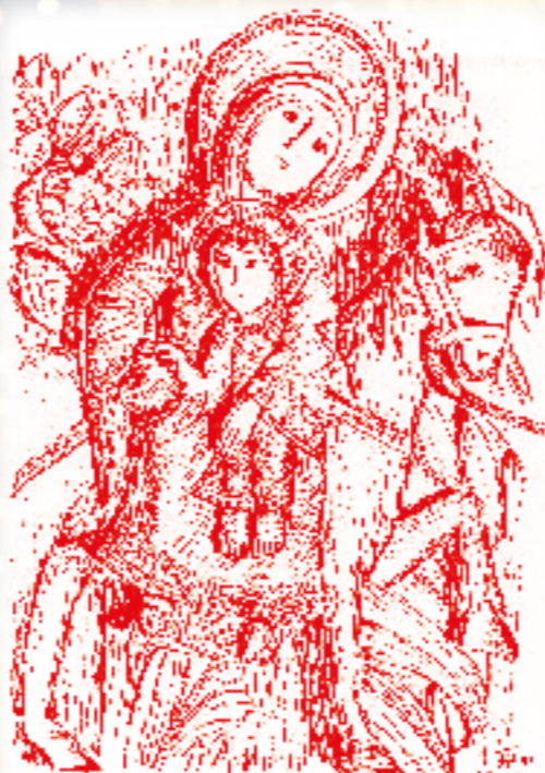
La fuite en Egypte (chapiteau de la cathédrale d'Autun)