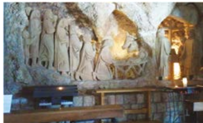
La photo ci-dessus illustrant a été prise dans l'exposition de crèches de l'église de Greccio, près d'Assise, là où François a vécu cette célébration de Noël en 1223.

Dès le XIII e siècle, des jeux scéniques ou « mystères », dans lesquels des fidèles miment la Nativité ou les Évangiles, sont organisés dans les églises, puis sur les parvis.