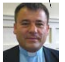
Wola Ranizowska Père Stanislas