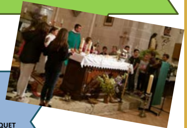
Messe de rentrée des enfants du caté à Sougy.