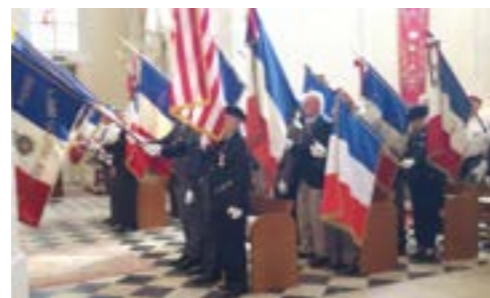
16 août Commémoration de la libération d'Artenay.

Un grand merci à vous tous, prêtres, organistes, chef de chœur, choristes et paroissiens qui nous permettent de perdurer cette belle fête des moissons dans nos villages, ainsi que toutes nos cérémonies chacun offrant à sa façon ses talents avec cœur et chaleur, sans oublier nos fanfares.