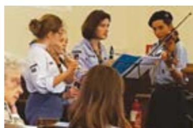
14 oct. Chevilly participation à l'animation de la messe par les scouts.