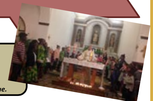
Messe de rentrée des enfants du caté à Cercottes Gidy.