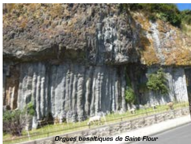
Orgues basaltiques de Saint Flour