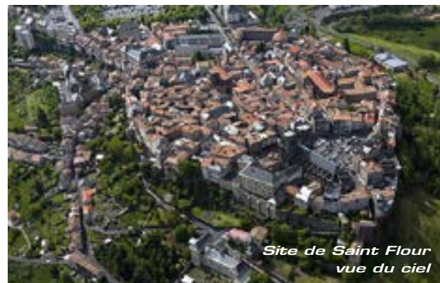
Site de Saint Flour vue du ciel

Pour bien comprendre et apprécier le site de Saint-Flour mieux vaut arriver par le côté Est ce qui permet de découvrir l'escarpement rocheux, les maisons alignées et les deux tours de la cathédrale à 100 mètres au dessus de l'Ander (affluent de la Truyère et donc sous affluent de la Garonne par le Lot).