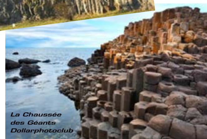
La Chaussée des Géants

Bien entendu si vous voulez admirer des orgues basaltiques spectaculaires force est de vous rendre en Irlande du Nord jusqu'à la Chaussée des Géants. La légende raconte comment le géant Finn Mac Cumhail a créé cette chaussée afin de traverser la mer d'Irlande pour aller combattre un géant écossais. La science explique qu'il s'agit d'une coulée de lave basaltique d'il y a 40 millions d'années.