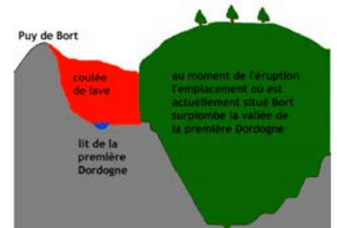
Le site de Bort les Orgues (coupe) au moment de l'éruption volcanique qui formera les Orgues à l'époque miocène pendant l'ère tertiaire.

Voyez aussi comment sur leur logo, ils ont réuni l'orgue et les orgues, d'où leur devise : « Au bord des Orgues ».