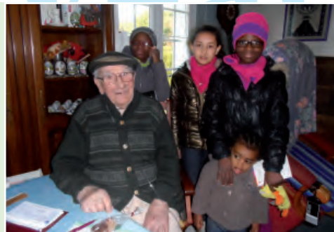
Les enfants de Boismorand

Merci à tous ceux et celles qui ont accompagné les jeunes au cours de ces visites.