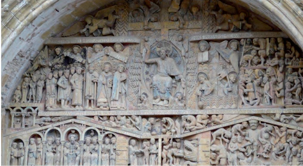
Portail de l'église de Conques