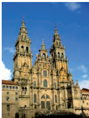
Cathédrale de Saint-Jacques-de-Compostelle

« Heureux toi le Pèlerin, si tu cherches la Vérité, et si ton chemin devient une Vie et ta Vie un Chemin tout en cherchant celui qui est lui-même, le Chemin, la Vérité, la Vie »